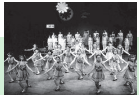
Szenen aus vergangenen Programmen des Cottbuser Kindermusicals, das jetzt mit einer großen Stadthallen-Gala seinen 40. Geburtstag feiert